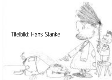
Titelbild: Hans Stanke

Dieser Artikel erschien zum ersten Mal in "LETS-Netz", Nr. 6/1998, Mnchen